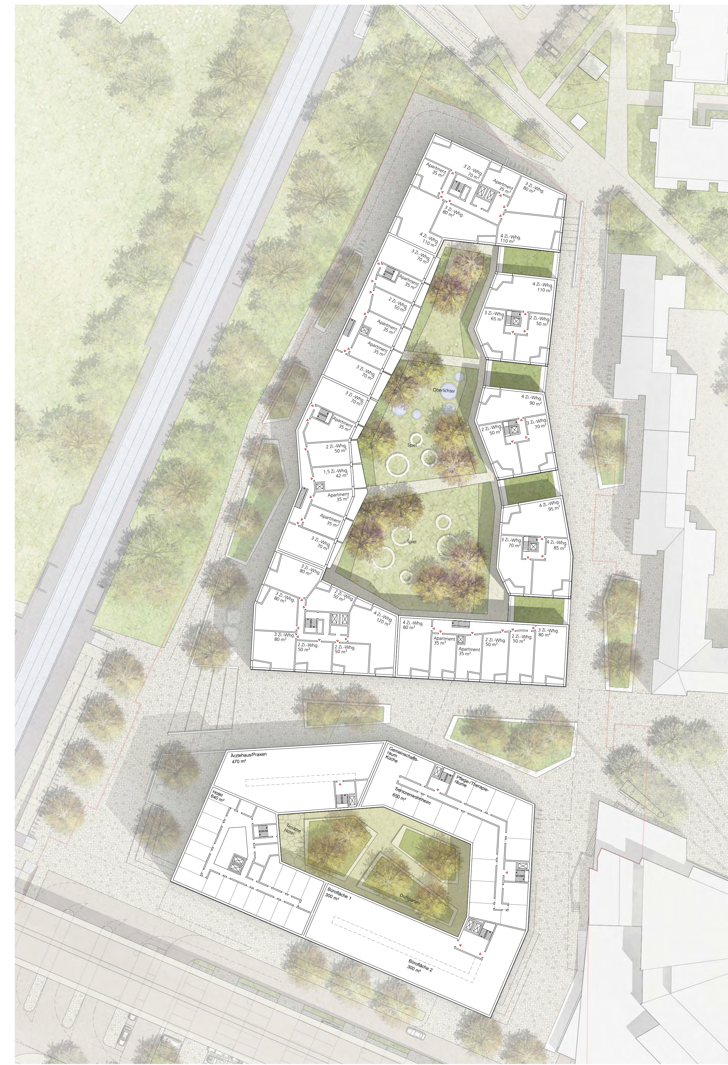
Vertiefung Regelgeschoss M 1:500