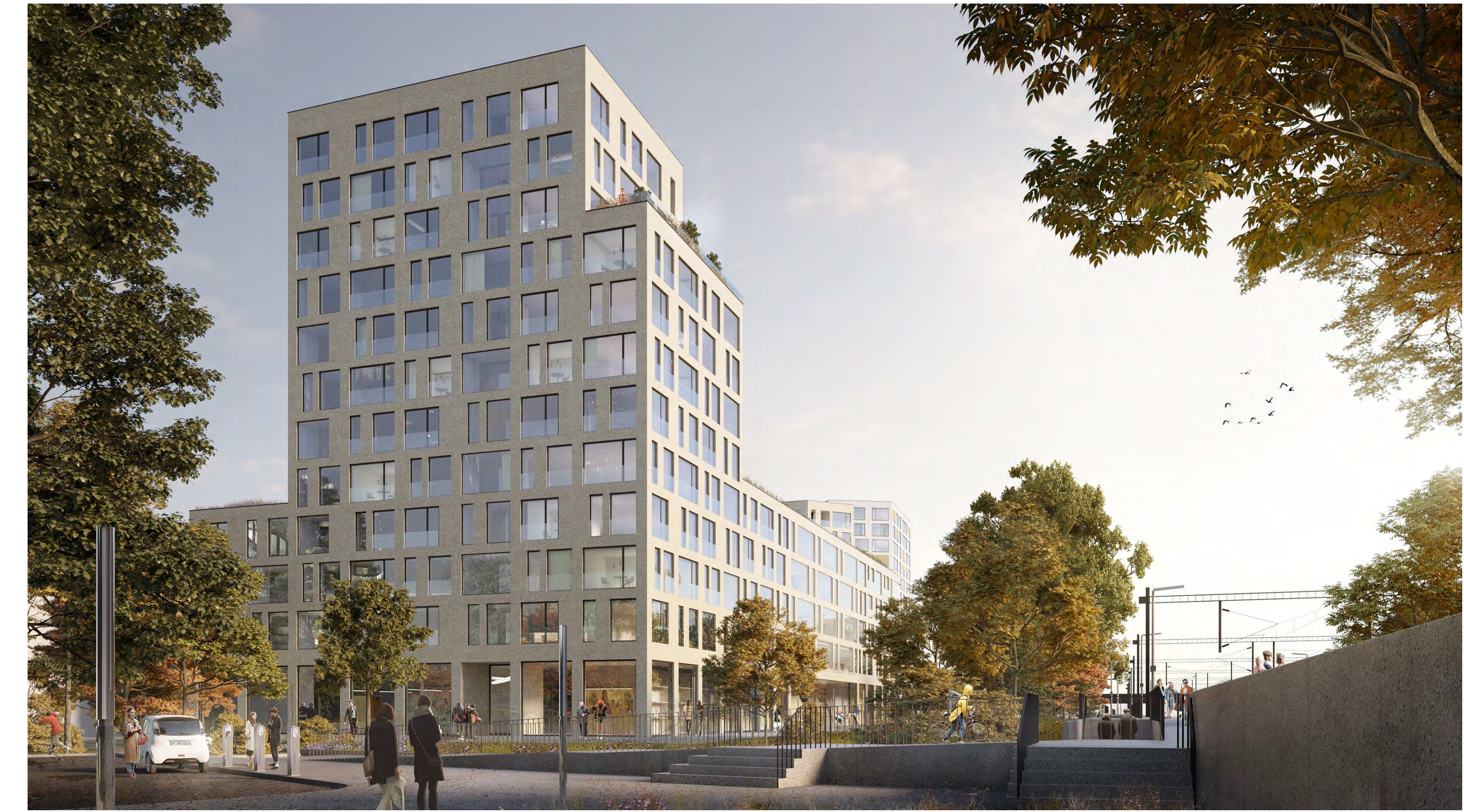
Visualisierung - Standpunkt S-Bahn-Parkplatz Nord, Variante Fassade