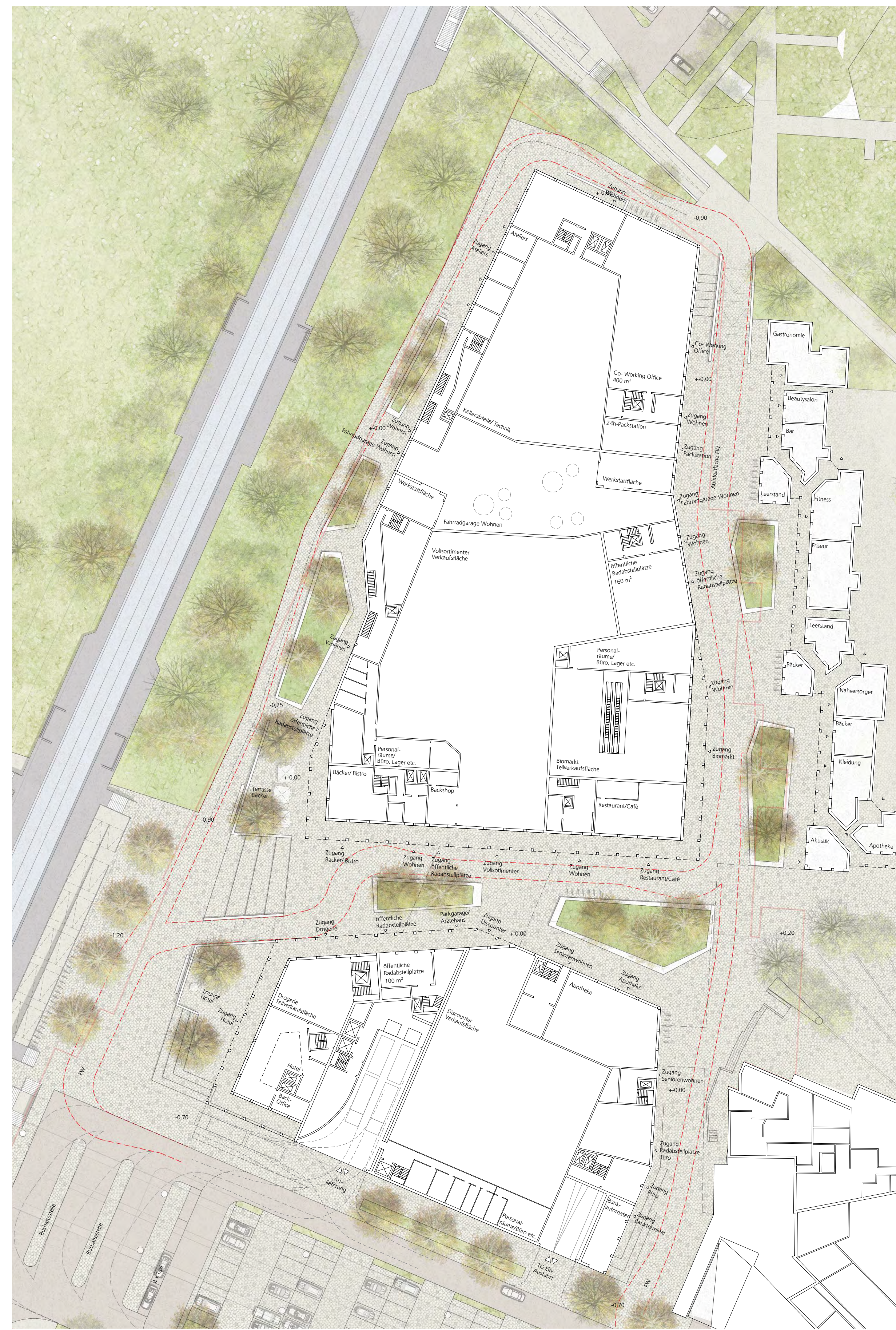
Vertiefung Erdgeschosszone M 1:500